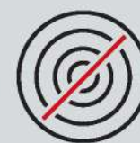
Ø 30 cm / 12" max.